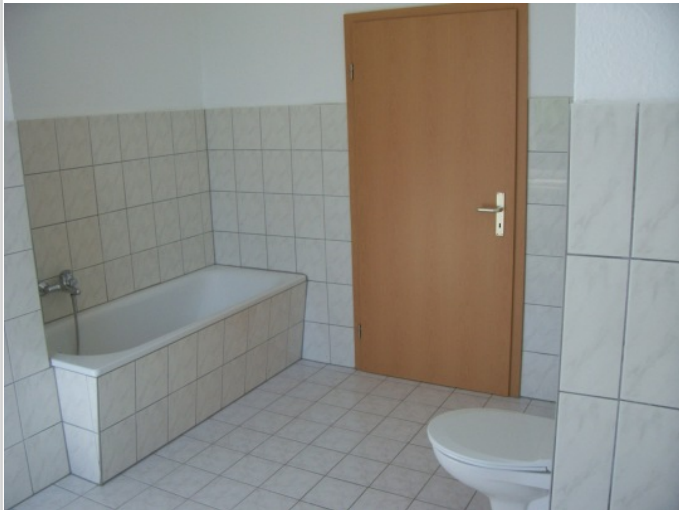
Badezimmer das Große