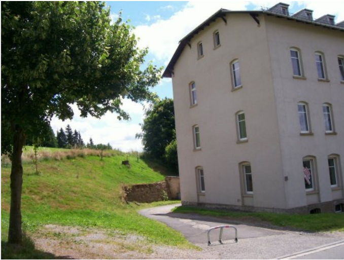
Zufahrt zum Haus

Zimmer: 3,00 Wohnfläche ca.: 85,00 m 2 Kaltmiete: 320,00 EUR (zzgl. Nebenkosten) Gesamtmiete: 490,00 EUR