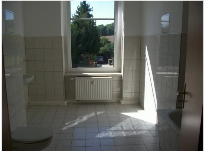
Bad mit Fenster