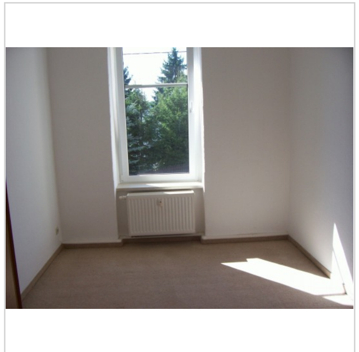
Schlafzimmer klein aber oho !!

Bei Bedarf kann ein Gartenanteil zur individuellen Nutzung kostenlos genutzt werden. Eine Einbauküche kann gegen Aufpreis bereitgestellt werden. Vor Abschluß eines Mietvertrages ist der Nachweis einer privaten Haftpflichtversicherung sowie die Vorlage einer Mietschuldenfreiheitserklärung vom Vorvermieter vorzulegen.