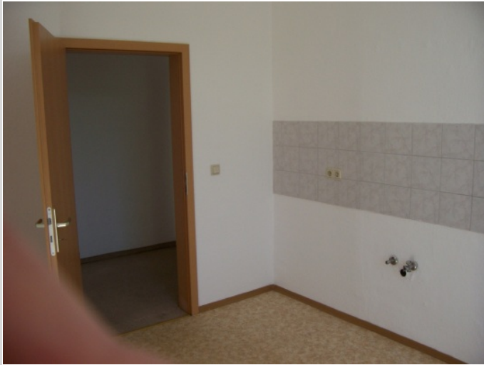
Küche die andere Ansicht

Zimmer: 3,00 Wohnfläche ca.: 85,00 m 2 Kaltmiete: 320,00 EUR (zzgl. Nebenkosten) Gesamtmiete: 490,00 EUR