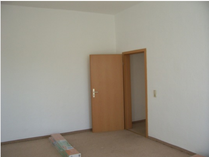
Wohnzimmer zum Zweiten